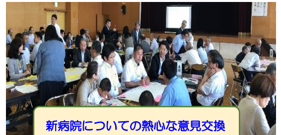
新病院についての熱心な意見交換

そのあと、「建物や医療サービスの側面から期待すること」「その実現のために住民ができること」をテーマに参加者全員でワークショップをしました。一般の参加者（市民）、市議会議員、病院スタッフ、設計事務所スタッフなど立場の異なるメンバー総勢56人が、9グループに分かれて意見交換を行い、収穫の多いワークショップとなりました。今後は、病院建設の設計や、病院経営において、ワークショップの意見を参考に活用していく予定です。