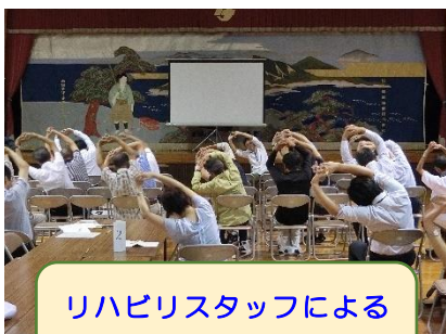
リハビリスタッフによる 「体ほぐし」