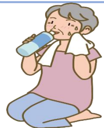
内科 木下 翼