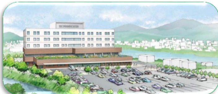
三豊市立新病院（仮称）イメージ図