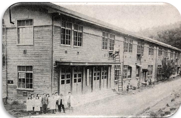
病院病棟(旧海軍航空隊営舎を改築)