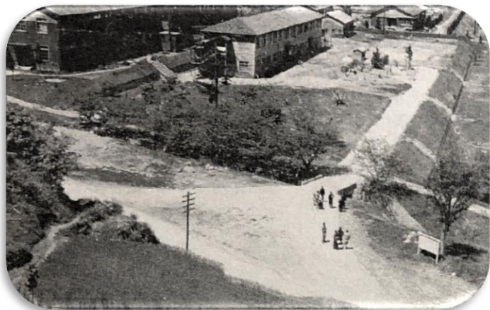
昭和 24 年開設当時の永康病院

病院名は、「 とこしえにやすらかなれ 」との願いを込めて「 永康病院 」と命名されました。