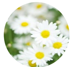
三豊市の花 マーガレット